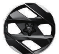
20" 'Monolithe' for GT