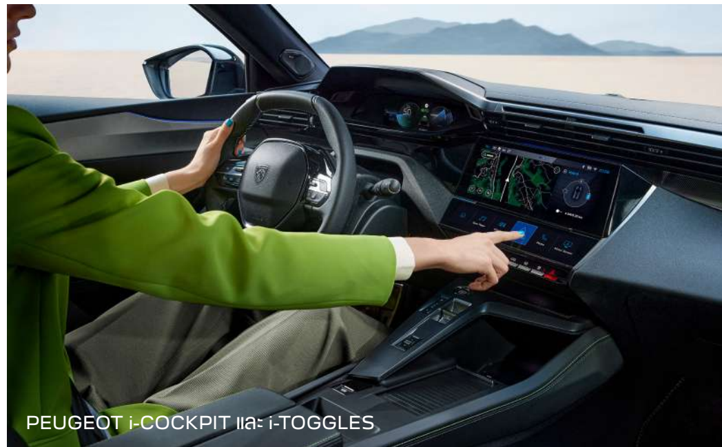
PEUGEOT i-COCKPIT และ i-TOGGLES

ยกระดับความสะดวกสบายด้วย PEUGEOT i-COCKPIT แสดงข้อมูลแบบ 3 มิติที่หน้าจอบู๊ทซ์บิ่ง และหน้าจอกกลางระบบสัมผัส 10 นิ้ว พร้อมระบบนำทาง สามารถเชื่อมต่อ Apple CarPlay และ Android Auto เสริมด้วยปุ่มลัด PEUGEOT i-TOGGLES เย็นสบายด้วยระบบปรับอากาศอัตโนมัติ 2 โซน และระบบกรองอากาศ AIR QUALITY PM 2.5