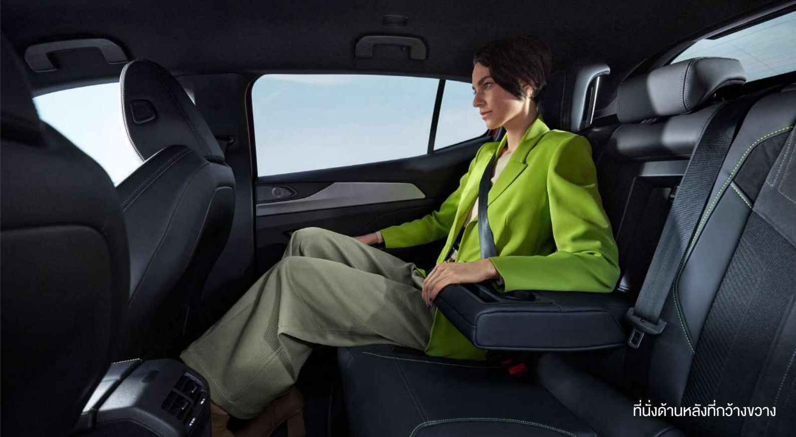
ที่นั่งด้านหลังที่กว้างขวาง